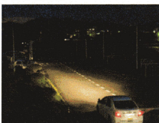
ロービームで撮影