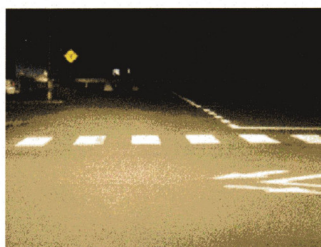
ロービームで撮影