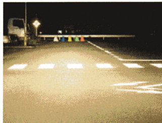
ハイロンまでの距離 60m